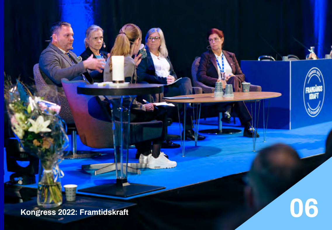
Kongress 2022: Framtidskraft